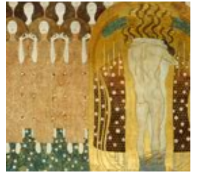
Het Beethovenfries.